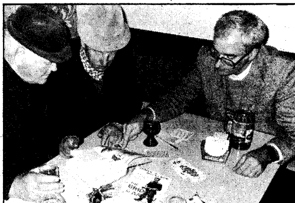
Österreicher als Hand Gottes: Reminiszzenzen in Andau

„Ich dachte damals, die Revolution in Ungarn würde auf die anderen osteuropäischen Staaten übergreifen,